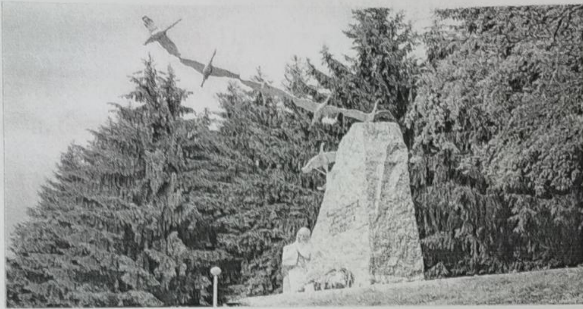
-1986 соналда Гъуниб рагъана Хъахлал къункърабазул памятник.